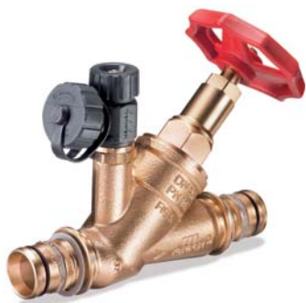
KEMPER Freistrom-Absperrventil mit fest angeessenem Geberit 'Mepla'-Anschluss Figur 190 41