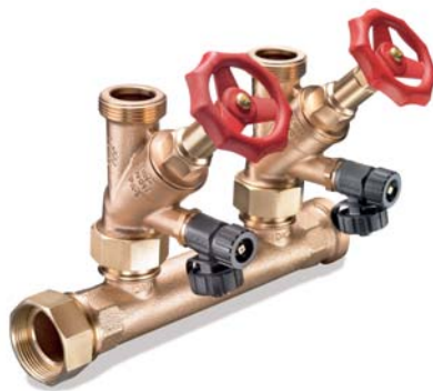
KEMPER Zweifach-Verteiler-Satz Figur V2