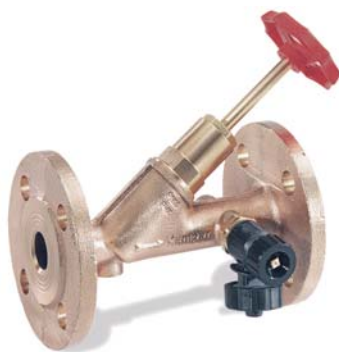
KEMPER Freistrom-Absperrventil mit Flanschanschluss Figur 135