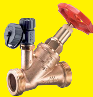
KEMPER Freistrom-Absperrventil mit flachdichtendem Außengewinde Figur 173