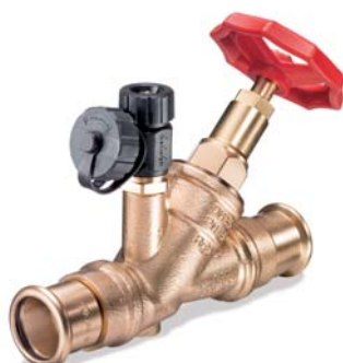
KEMPER Freistrom-Absperrventil mit fest integriertem Pressanschluss 'Sanha' Figur 190 36