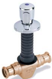
Figur 560 22