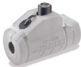
Figur 471 11