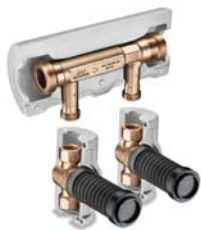
Figur 640 01