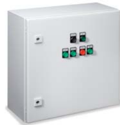
Figur 686 02