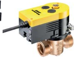
Figur 686 00