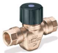
Figur 131 00