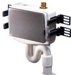
Figur 686 03