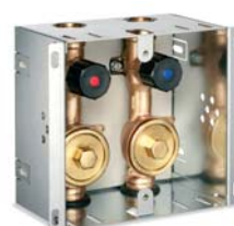
Figur 870 07