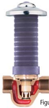
Figur 540 02