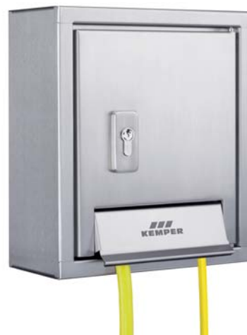
KEMPER 'Mini-Tresor' Wandaufputzschrack Figur 212, H/B/T: 315x280x132 mm