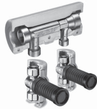
640 03 KHS-Venturi-Strömungsteiler-Gruppe für UP-Montage mit IG