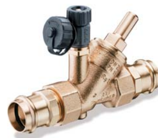
KEMPER Rückflussverhinderer mit fest integriertem Pressanschluss Viega Figur 195 31