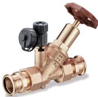
KEMPER Kombi-Rückflussverhinderer mit fest integriertem Pressanschluss mapress Figur 193 23