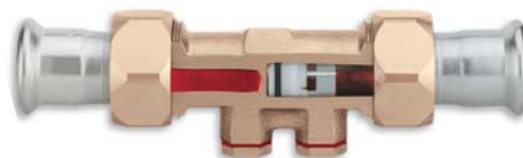
KEMPER Rückflussverhinderer (RV) zum Sichern Figur 158