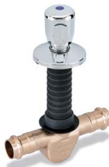
KEMPER 'UP-plus' mit fest integriertem Pressanschluss 'sanpress' und 'profipress' Figur 524