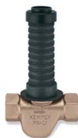
KEMPER 'UP-plus' mit Muffenanschluss Figur 560 01

KEMPER hat für Kupfer-, Edelstahl-, Kunststoff-, Verbund- oder Stahlrohr den richtigen Anschluss.