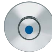
KEMPER Steckschlüsseloberteil Figur 591