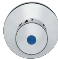
KEMPER Originalgriff Figur 590

Durch die KEMPER Adapter steht Ihnen außerdem die ganze Design-Vielfalt von Bediengriffen bekannter Markenhersteller offen.