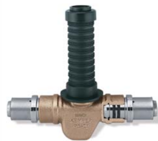
KEMPER 'UP-plus' mit 'Click'-Anschluss für verschiedene Rohrsysteme Figur 560 08