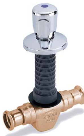
KEMPER 'UP-plus' mit fest integriertem Pressanschluss 'mapress' Figur 560 22

Das breit gefächerte KEMPER 'UP-plus'-Programm lässt Planern und Installateuren freie Hand, wenn es um die Wahl von Werkstoff und Design, Funktion und Montage, Anschluss- und Verbindungstechnik geht. Diese Vielseitigkeit bietet nicht nur ein komplettes Paket wichtiger Vorteile, sondern zahlt sich auch durch die Einsparung von Kosten bei jeder Montage aus: Flexibilität für jede Wand und jeden Trend. Mit zukunftsweisender Technik.