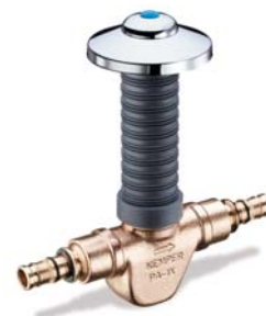
KEMPER 'UP-plus' mit fest angegossenem Geberit 'Mepla'-Anschluss Figur 560 09 + 591 00