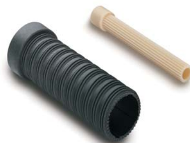
Verlängerungsset für 'UP-plus' Figur 599

KEMPER 'UP-plus' passt sich allen Erfordernissen an: Je nach gewünschter Einbautiefe in Mauerwerk, Register oder Schacht können Sie das Ventiloberteil verlängern.