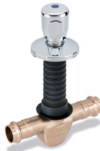
KEMPER 'UP-plus' mit fest integriertem Pressanschluss 'sanpress' und 'profipress' Figur 524