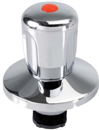
KEMPER Originalgriff Figur 590

Die KEMPER Originaloberteile passend für Absperr-WZ-Kombinationen mit Unterputzventilen 'UP-plus'