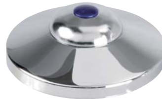
KEMPER Steckschlüsseloberteil Figur 591