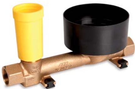
Absperr-WZ-Kombination 'Rg 120' Figur 855 47