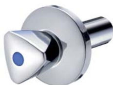
KEMPER Originalgriff Kunststoff, bis 32 mm Figur 596 03