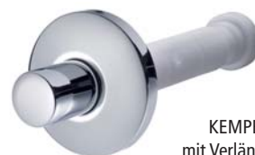
KEMPER Behördenoberteil mit Verlängerung, bis 120 mm Figur 596 05