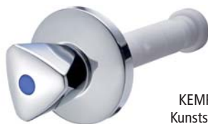
KEMPER Originalgriff Kunststoff, 30-120 mm Figur 596 04