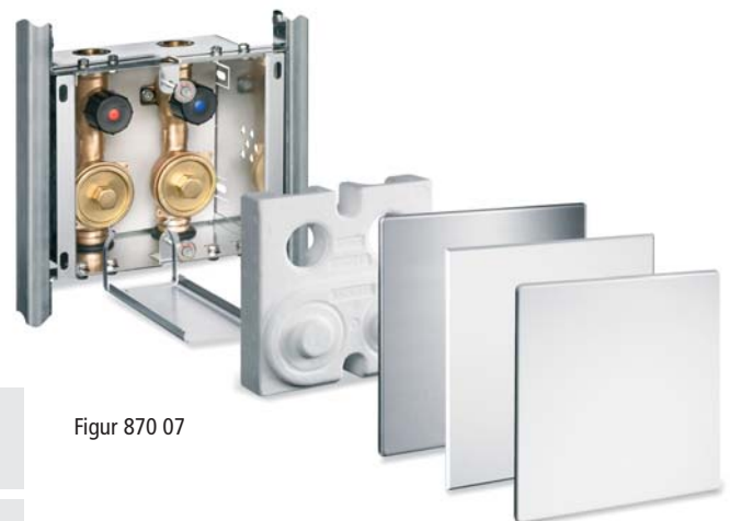
Figur 870 07