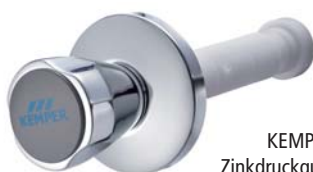
KEMPER Originalgriff Zinkdruckguss, 30-120 mm Figur 596 02