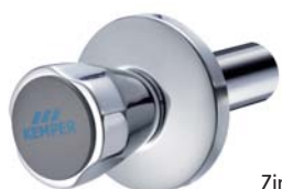
KEMPER Originalgriff Zinkdruckguss, bis 32 mm Figur 596 01