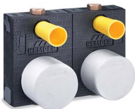
Montageblock 'Rg 120 DUO' Figur 854