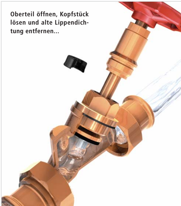
Oberteil öffnen, Kopfstück lösen und alte Lippendichtung entfernen...

Für Betreiber von Großanlagen, z.B. Krankenhäuser, bieten KEMPER Absperrventile einen zusätzlichen Vorteil in der Anwendung. Die Oberteil-Lippendichtung ist im Bedarfsfall auch 'unter Druck' einfach und sicher zu wechseln.