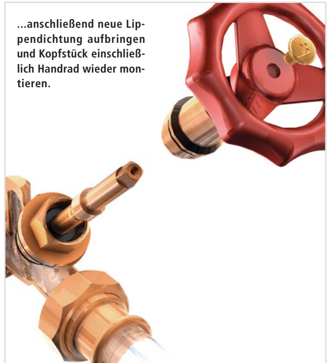
...anschließend neue Lippendichtung aufbringen und Kopfstück einschließlich Handrad wieder montieren.

➤ Austausch der Lippendichtung unter Systemdruck