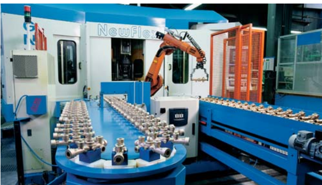
Be- und Weiterverarbeitung