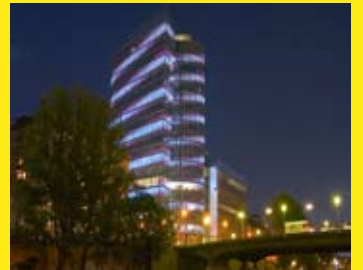
Uniqa Tower, Wien