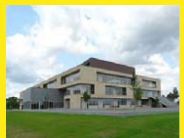
Dänisches Gymnasium Schleswig