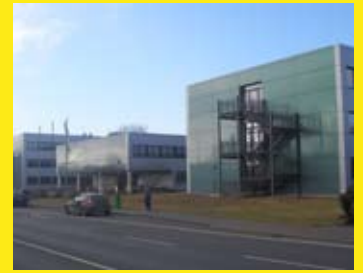
Berufsbildende Schule, Wittlich

Mit beteiligt an der ökologischen Gebäudeausrichtung ist KHS durch Reduzierung der Wasserwechsel- und Zirkulationswärmeverluste.