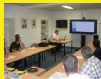
Schulung für das Technische Personal