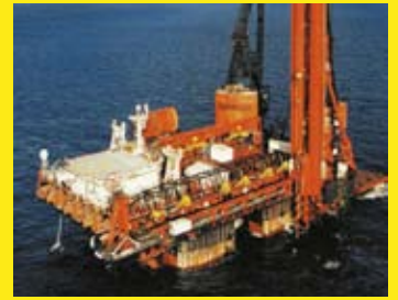
Hereema DCV Balder

erbaut. KHS-Hygienespülungen und KHS-Venturi-Strömungsteiler sorgen für einen automatisierten Wasserwechsel und reduzieren somit Personal- und Betriebskosten.