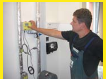
Programmierung der KHS-Mini Systemsteuerung