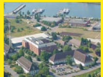
Bundespolizei, Gebäude Nr. 44, Neustadt i. H.